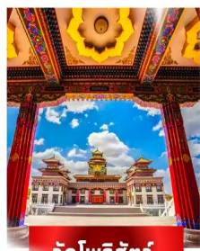
วัดโพธิ์สัตว์