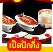
เปิดปิ้งกั๊ง