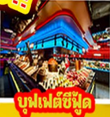
บูฟเฟต์ซี่ฟู้ด