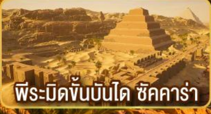
พีระมิดขั้นบันได ชิคคาร์่า