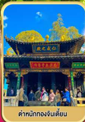
ตำหนักทองจินเตียน