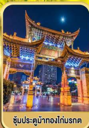
ซุ้มประตูม้าทองไถ่มรดก