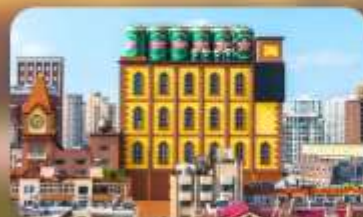
โรงงานเบียร์ซิงเต๋า