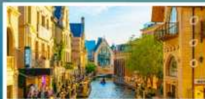
เมืองน้ำเวนิสตะวันออก