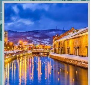
“OTARU CANAL FEST”