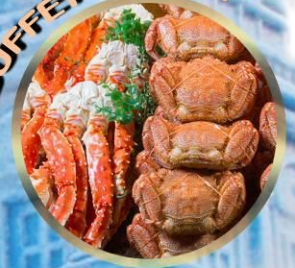
SAPPORO SNOW FESTIVAL 2027