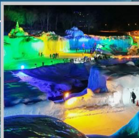
“SOUNKYO ICE FEST”