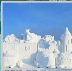
“ASAHIKAWA SNOW FEST”