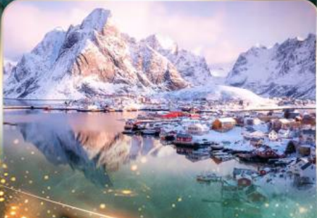
หมู่บ้านเรนเน

นอร์เวย์ แสงเหนือสุดฟิน เช็กอินสุดว้าว 10 วัน 7 คืน