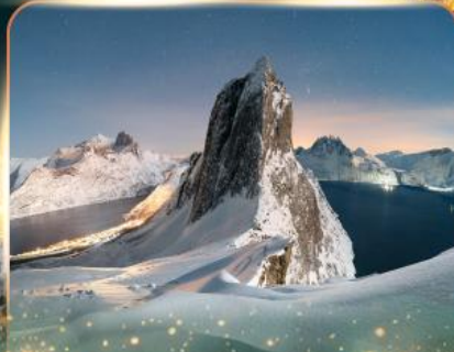
เกาะเซนญา