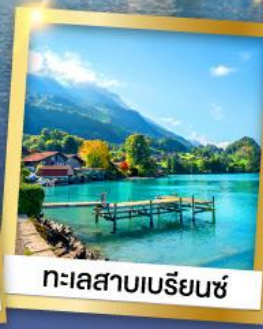
ทะเลสาบเบรีนซ์