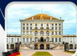
พระราชวังนิมเฟนบวร์ก